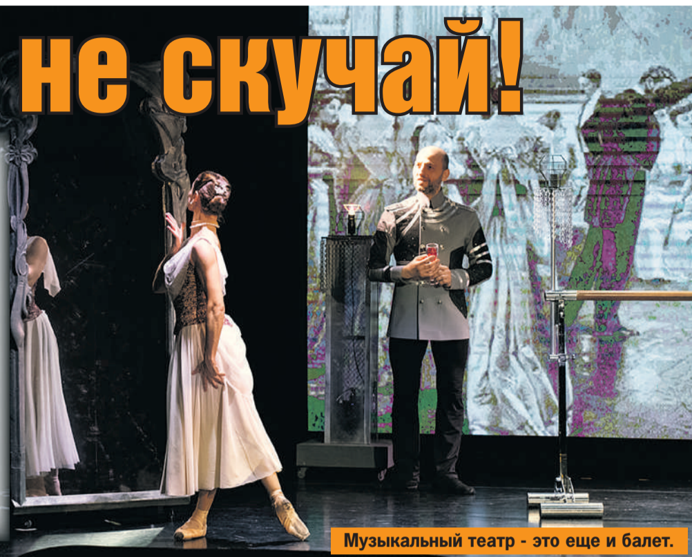
Музыкальный театр - это еще и балет.

Выходной за выходным - первая половина мая традиционно такая. Провести эти дни, конечно, лучше с пользой. Возможно, вы уже составили для себя расписание, где есть место всему - от прогулок на свежем воздухе и генеральной уборки до культурной программы. Если же нет, срочно знакомьтесь с афишей.