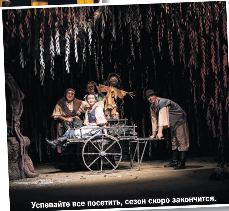
Успевайте все посетить, сезон скоро закончится.

Спросите, а есть ли что-то для тех, кто и говорить-то еще не умеет? Конечно! Например, спектакль «Руквичка» для малышей от одного года. Он шел зимой и постоянно собирал аншлаг. Интермедия проводилась в формате «театр на подушках». Для тех, кто чуть постарше, в афише «Наш дом – теремок», спектакль-игра «Бука. Вредный зайчик», чудо-небылицы в