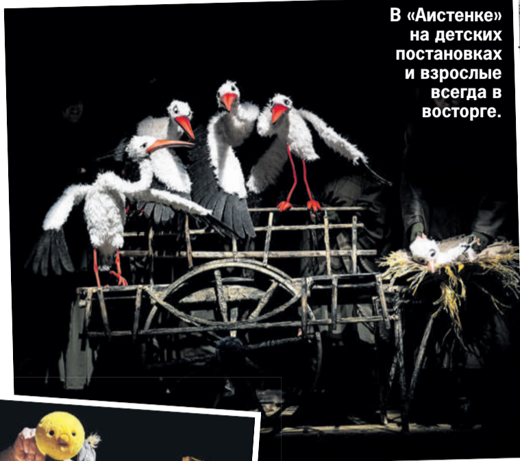
В «Аистенке» на детских постановках и взрослые всегда в восторге.

Зрительные места на подушках, цирк на сцене, сказки и волшебство – иркутские театры используют разные форматы, чтобы привлечь зрителей «от нуля и старше». Преуспевают в этом театр кукол «Аистенок» и ТЮЗ имени Александра Вампилова. Билеты нарасхват. Нередко среди публики – малыши, которые едва научились ходить, но уже привели в театр родителей или бабушек и дедушек. Что представят на подмостках в ближайшее время? Готовят ли премьеры? Будет ли интересно на показе родителям? Ответы на эти вопросы – в нашем материале.