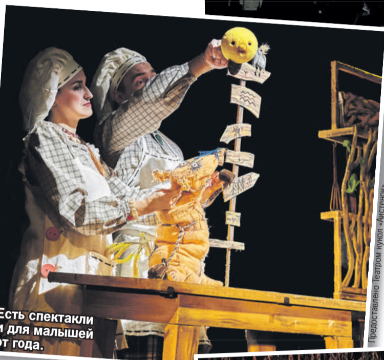
Есть спектакли и для малышей от года.

«Аистенок» – театр кукол. Именно из-за этого он вос-