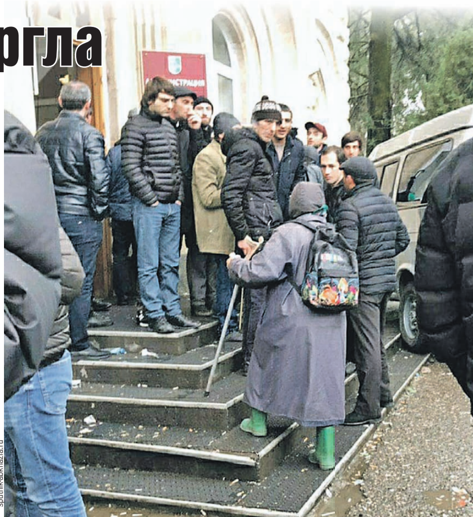
Бабушка пришла в Сухум ко дворцу за пенсией - а тут опять революция!

Хаджимба не захотел (или не смог) защитить даже своего вице-президента, которого побили какие-то влиятельные люди. Не