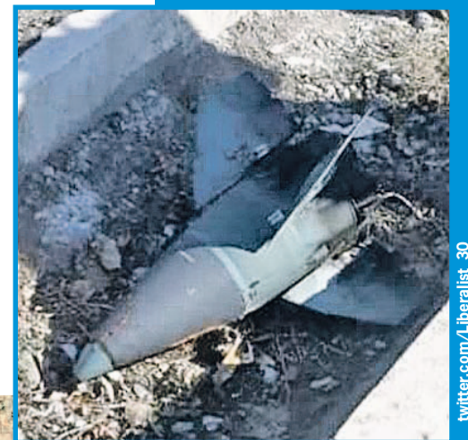
Головной обтекатель боевой части ракеты, поразившей «Боинг».

В итоге, несмотря на всю взаимную неприязнь, и Запад, и Иран неожиданно сходятся в одном: запуск той роковой ракеты «земля - воздух» произошел по ошибке. Похоже, это объяснение и можно считать наиболее близким к правде?