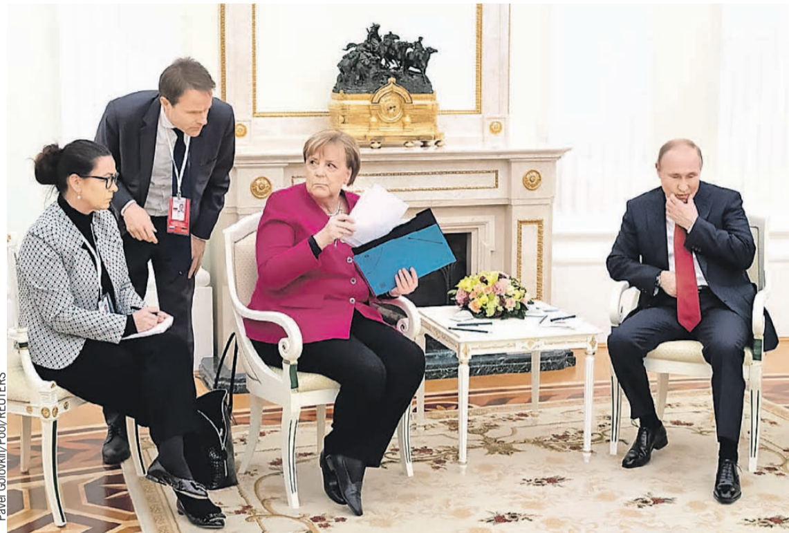
Канцлер Ангела Меркель прилетела в Москву, чтобы подтвердить президенту Владимиру Путину свою решимость сделать все ради получения газа из России напрямую.

стоятельно, без привлечения иностранных партнеров, - подтвердил Путин. - Вопрос в сроках. Это единственный вопрос, который встанет в этой связи. Окончание строительства будет отодвинуто на несколько месяцев.