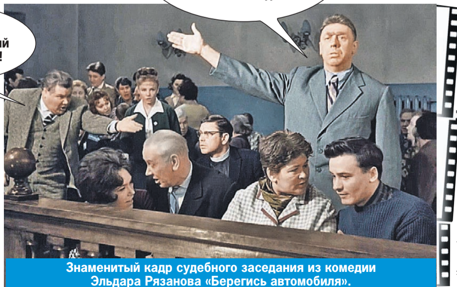
Знаменитый кадр судебного заседания из комедии Эльдара Рязанова «Берегись автомобиля».

- Для нас, элиты, должен быть особый Уголовный кодекс!