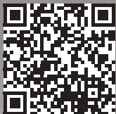
Фото присылайте в «Комсомольскую правду», e-mail: miss@kp.ru

Голосуйте за понравившуюся вам участницу на нашем сайте KP.RU в разделе «Будь стильной с «КП»!»