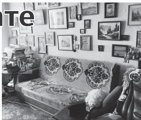
Одинцовы через суд пытаются выселить из купленной квартиры прежнюю владелицу.

Прошло несколько дней - новый звонок. На этот раз от «сотрудников банка». Те ска-