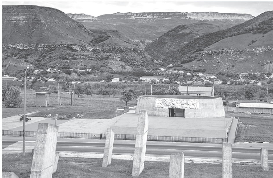
Музей-памятник защитникам перевалов Кавказа обновили впервые с открытия в 1968 году. Сохранив советскую экспозицию, музейщики добавили современную интерактивную часть.

появляются новые имена, а слушатели открывают для себя музыку заново.