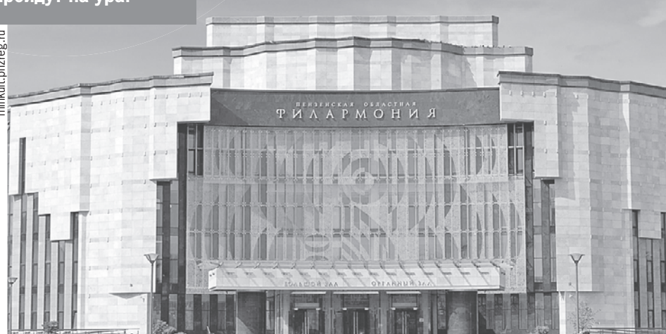
Здание филармонии построили в Пензе к 350-летию города. Под одной крышей собрали все: зал для органной музыки, зал для исполнения классической музыки, площадку для концертов и кино. Сейчас у здания отремонтировали крышу.