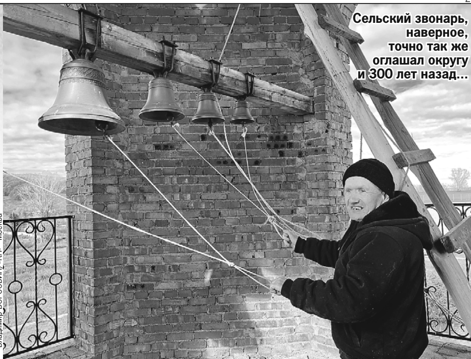
Сельский звонарь, наверное, точно так же оглашал округу и 300 лет назад...

Так, оказывается, пела в конце XIX века ее