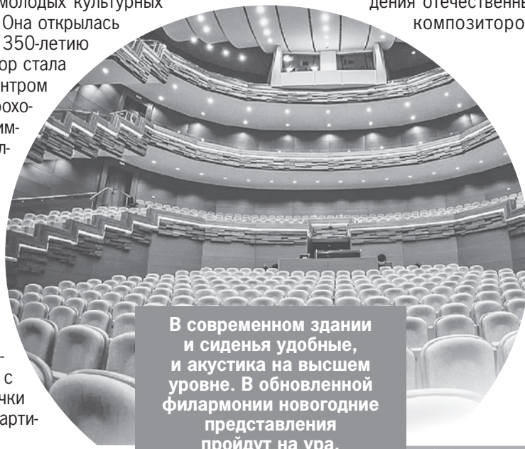
В современном здании и сиденья удобные, и акустика на высшем уровне. В обновленной филармонии новогодние представления пройдут на ура.

В начале зимы Пензенская филармония традиционно устраивает концерты «Звучи, Россия!», где играют лучшие произведения отечественных композиторов.