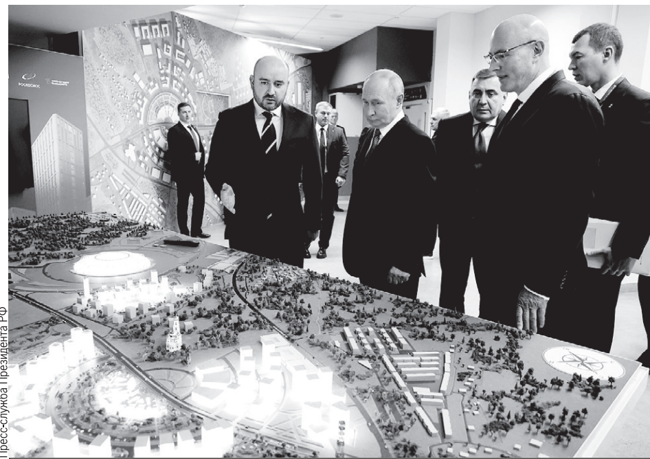
Вячеслав Федорищев представил Владимиру Путину проект строительства межвузовского студенческого кампуса и микрорайона.

Кульминацией деловой программы форума стало пленарное заседание «Спорт во имя будущего: побеждаем