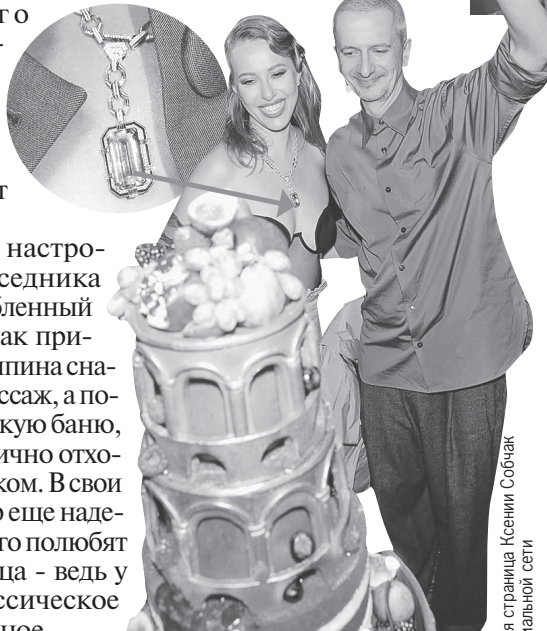
Камень на груди Собчак сложно не заметить.

ладится и личная жизнь, появятся дети - уже не для шоу, а в реальной жизни. Правда, формально ребенок у него уже есть: артист уверяет, что волею случая стал донором спермы и его биоматериал точно был пущен в ход.