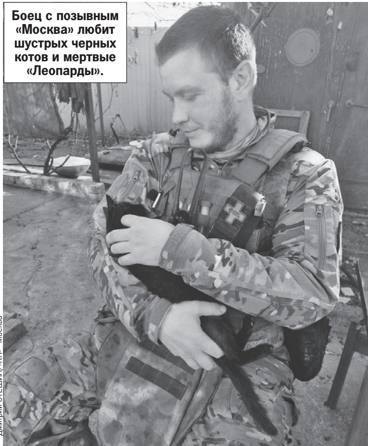
Дмитрий СТЕПИН/«КП» - Москва

Боец с позывным «Москва» любит шустрых черных котов и мертвые «Леопарды».