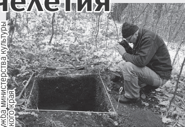
Рядом с древними рисунками ученые нашли городище.

В писаницу входят три рисунка. Это две маски (личины), похожие на известные петроглифы в Си-