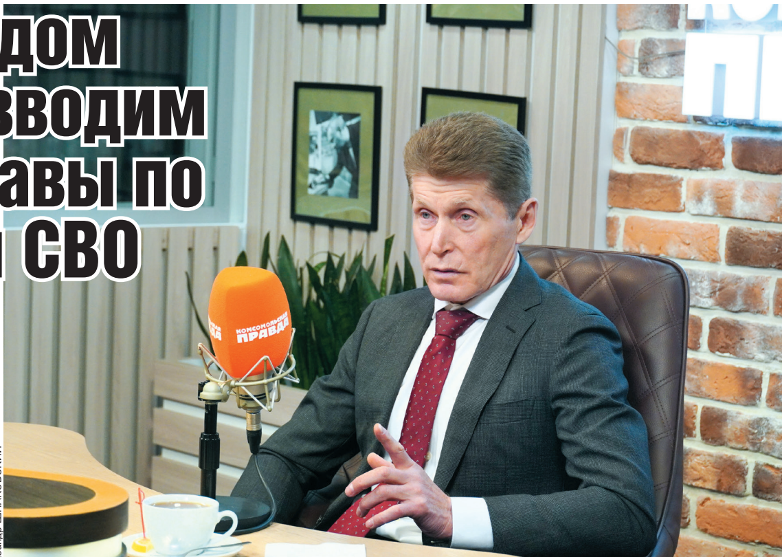
Губернатор Приморского края Олег Николаевич Кожемяко.

- Ну, как-то был, наверное, месяца полтора назад... Дух у ребят боевой.