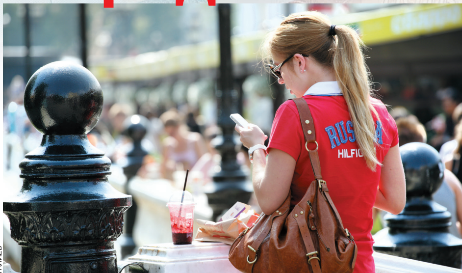
Дуэт аферистов оставил девушку с огромным долгом в банке после года общения в Сети.