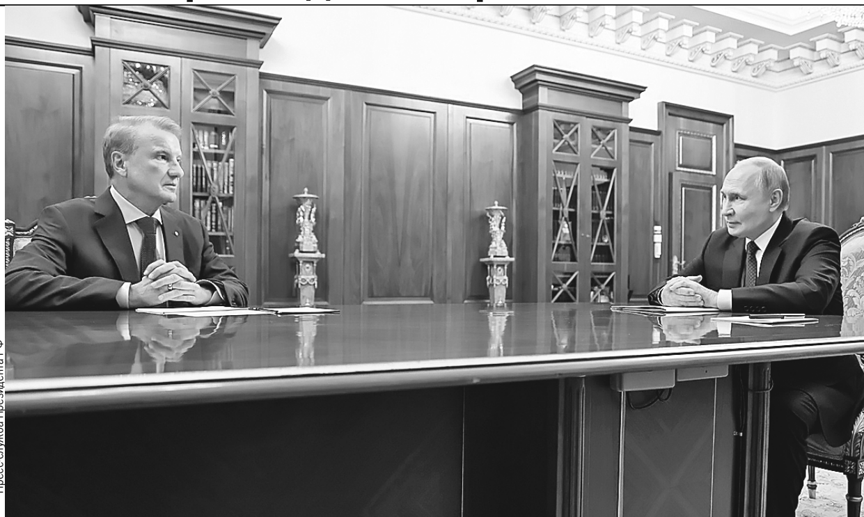
«Сбер» по итогам прошлого года показал отличные результаты, этому свидетельство - рекордные дивиденды. В этом году ситуация немного иная, рассказал Герман Греф Владимиру Путину.

- Отлично. Хорошо, - подытожил Путин... как раз улыбкой.