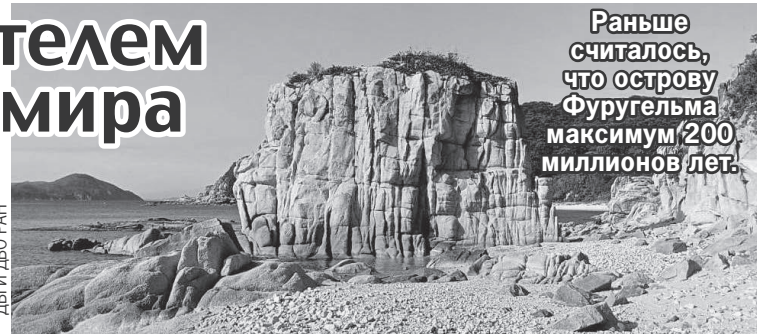
Раньше считалось, что острову Фуругельма максимум 200 миллионов лет.

Геологи использовали точный уран-свинцовый метод для изучения кристаллов циркона, найденных на