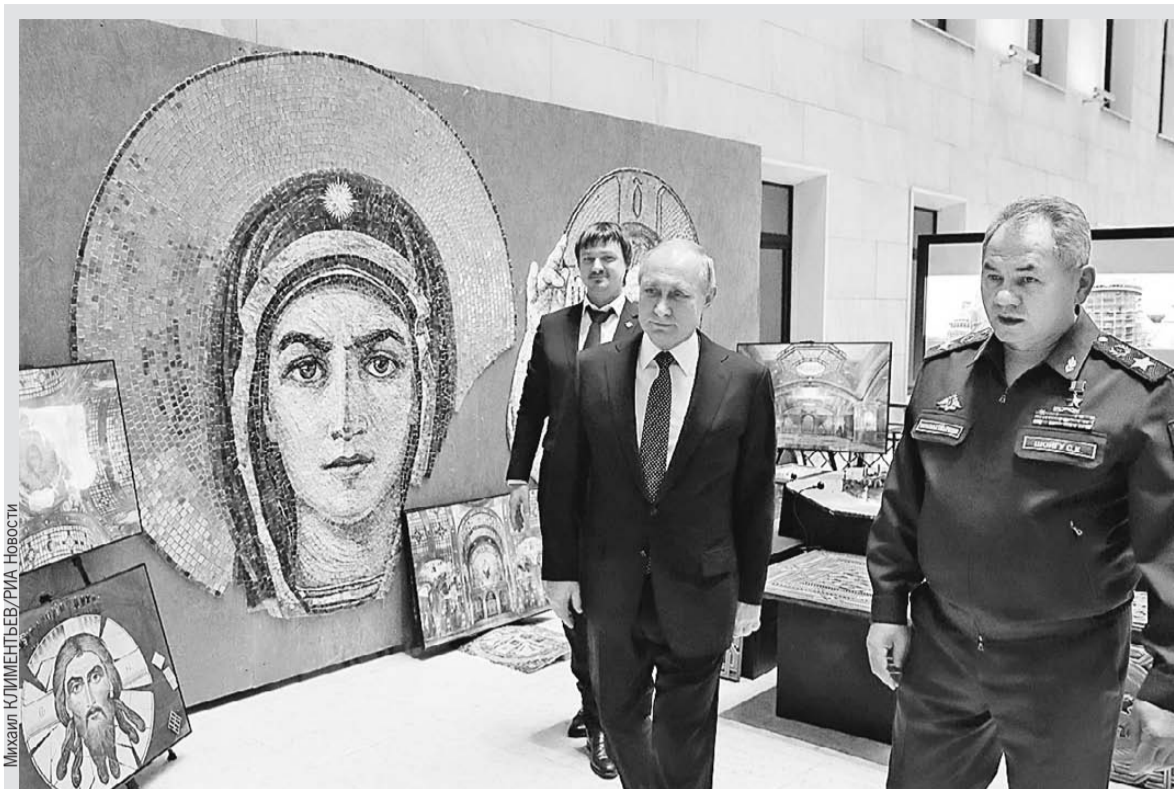
Владимир Путин приехал во вторник на ежегодную коллегию Минобороны. А перед этим Сергей Шойгу провел президента по выставке, на которой были не только новые вооружения, но и образцы внутреннего убранства Главного храма Вооруженных сил, который строится в Подмоскowie к 75-летию Победы.

- Я пью даже не чай, а заваренные, облитые кипятком травы с Алтая.