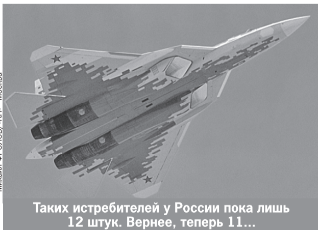
Михаил ФРОЛОВ/«КП» - Москва

Срочно поднятый в воздух поисково-спасательный вертолет быстро обнаружил дымящуюся воронку от врезавшегося в землю истребителя. А в нескольких километрах - приземлив-