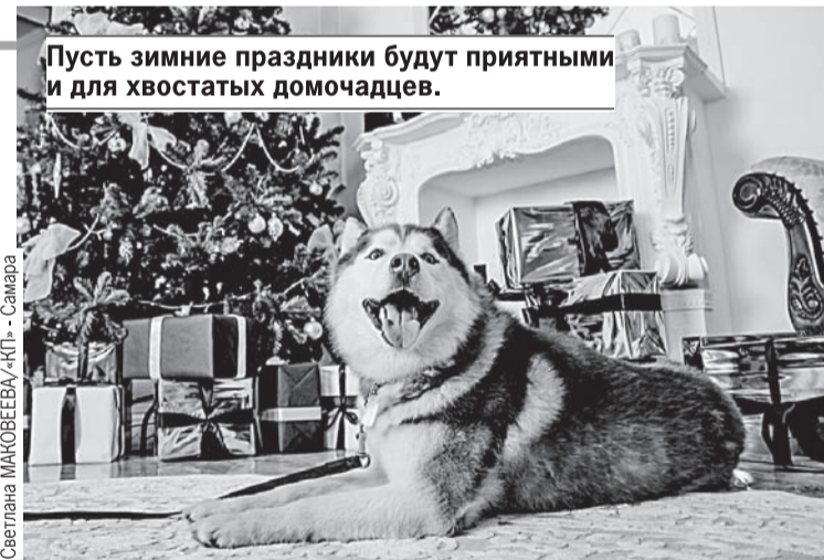
Пусть зимние праздники будут приятными и для хвостатых домочадцев.

крыть территорию Кремля для свободного посещения граждан. До этого, с 1918 года, действовал строгий пропускной режим. Позднее в Кремле елку стали наряжать и на Соборной площади. А еще - в нижнем Тайницком саду, благо сюда лесную красавицу везти не надо было - сама по себе росла. Здесь же в 60-х заливали длинную пологую ледяную горку для детей. Ух, захватывает дух!