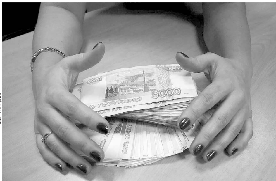
Во время суда женщина предложила погасить долг, но микрофинансовая организация попросила наказать ее по всей строгости.

После этого обычно МФО убеждается в отсутствии у нее договора с вами и удаляет сведения из кредитной истории. У таких организаций, как правило, есть отдел по борьбе с мошенничеством, с которым можно также урегулировать вопрос. Если все же общение с МФО не помогло решить проблему - придется оспаривать факт выдачи займа через суд.