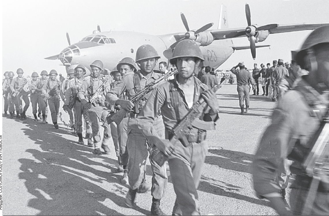
Советский спецназ высаживается в Афганистане. Весна 1988-го.

В самом СССР эта война поначалу держалась в секрете. Газеты и телевидение хранили молчание о ее размахе и потерях, сообщая лишь об исполнении «интернационального долга» в Демократической Республике Афга-