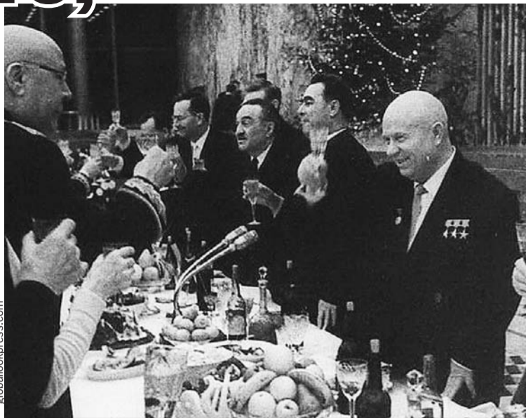
Маршал Советского Союза Семен Тимошенко (на фото - слева) поздравляет первого секретаря ЦК КПСС Никиту Хрущева с Новым годом. Справа от Никиты Сергеевича - его соратники Леонид Брежнев и Анастас Микоян. Москва, Кремль, декабрь 1963 г.

Постышев так и сделал: осудил «левый елочный загиб» и рекомендовал «положить ко-