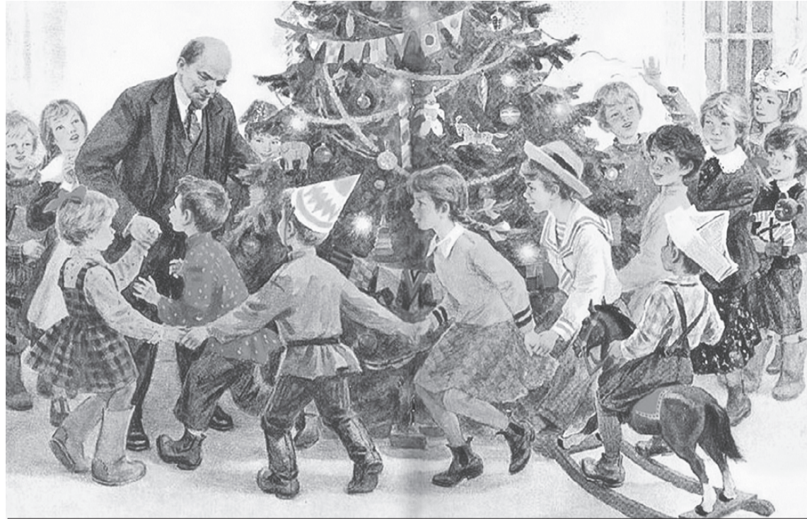
Детский новогодний хоровод с дедушкой Лениным. Поздравительная открытка. 1950-е годы.

ной хороминой на Красной площади, в Тайницком саду у зданий Старых и Новых приказов и у Лобного места, перед Спасскими воротами.