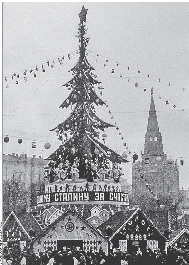
Москва, елка у Троицких ворот. В Кремле - товарищ Сталин, а на новогодней елке среди украшений - здравица в честь великого вождя. 1937 год.

Оказывается, в то время государь заложил не один, а целых три Александровских сада - Верхний, Средний и Нижний - от Угловой Арсенальной до Водовзводной башни: для «красоты и прогулок и праздных забав». Сегодня сад перестали делить на части: теперь он просто один Александровский. Но 200 лет назад народ охотнее всего шел именно к верхней большой рождественской и новогодней елке - у декоративного грота «Руины».