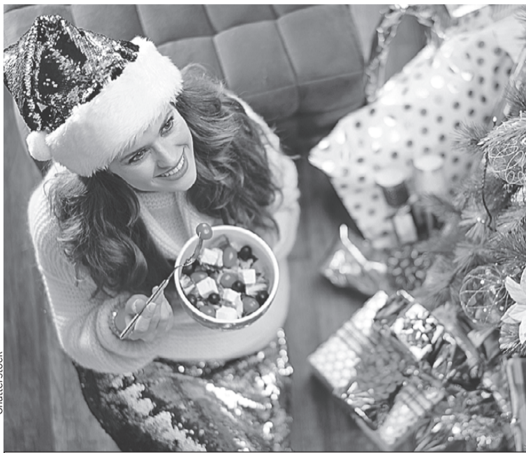
Даже полезной закуски должно быть в меру.

цепт. Картофеля кладите самый минимум, как будто это дорогой деликатес. Во-вторых, вместо покупного майонеза возьмите более легкую заправку (например, греческий йогурт или сметану) или сделайте домашний майонез. Так вы будете знать, что использовали самые свежие и натуральные компо-