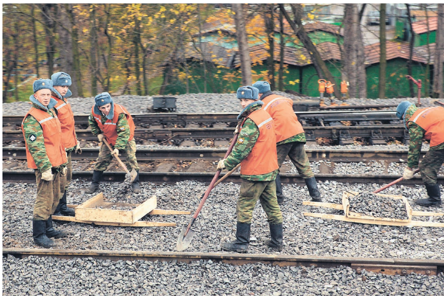
Железнодорожные войска готовятся расширять фронт работ на Восточном полигоне

«Учитывая дефицит трудовых ресурсов и производственных мощностей строительных организаций на отдалённых территориях Сибирского и Дальневосточного федеральных