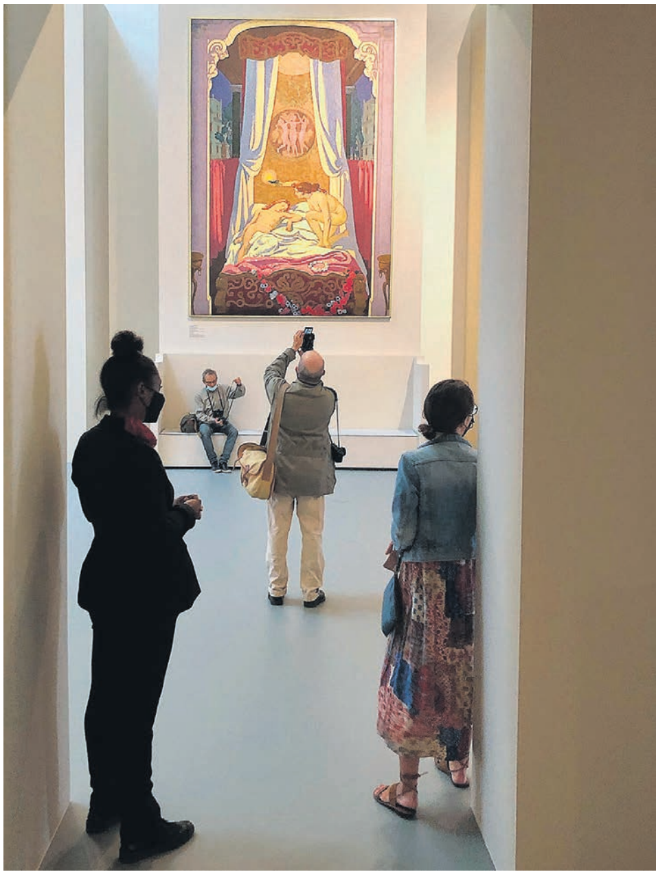
Морис Дени, так не нравившийся современникам в московском доме Ивана Морозова, в Париже смотрится особенно торжественно

Как же воспринимает Морозовых француз? Удивлены, что здесь не одна коллекция, а сразу несколько. Во-первых, соединены работы, принадлежавшие братьям Михаилу Абрамовичу Морозову (1870–1903) и Ивану Абрамовичу Морозову (1871–1921), собиравшим разное искусство — это и европейское, и русское искусство, работы художников тогдашней Российской Империи. Не только признанные