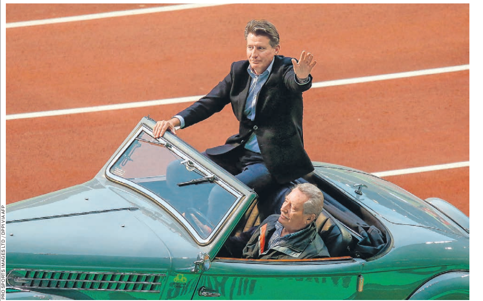
Президент ВА Себастьян Коу отметил, что возглавляемая им федерация стала за 2020 год «храбрее, сильнее, устойчивее, инновационнее, креативнее, более уверенной в себе и будущем легкой атлетике»

Международная федерация легкой атлетики (World Athletics, WA) отчиталась о том, что успешно прошла 2020 год, в котором из-за пандемии коронавируса была сорвана или перенесена большая часть соревнований. В отчете WA указывается, что федерация даже сумела получить прибыль — $2,1 млн, чего с ней не случалось ни в 2019-м, ни в 2018-м, когда COVID-19 еще не заявил о себе. Юанс в том, что выйти в прибыль WA смогла во многом за счет того, что получила почти $7 млн в виде штрафа от Всероссийской федерации легкой атлетики (ВФЛА), наказанной за многочисленные допинговые нарушения.