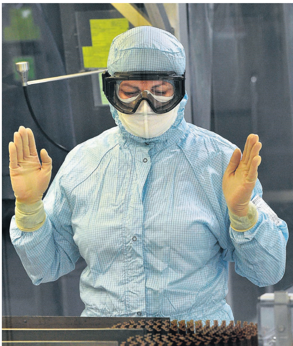
Из-за переоборудования производства в центре Чумакова «КовиВак» еще не скоро будет доступен россиянам

Центр не вводит в обращение новые серии из-за остановки площадки по производству сырья для препарата, говорят два источника «Б» на фармрынке. Разработчик устанавливает новое оборудование для масштабирования выпуска субстанции, поясняет гендиректор DSM Group Сергей Шуляк. По его словам, имеющиеся опытно-промышленные мощности не позво-