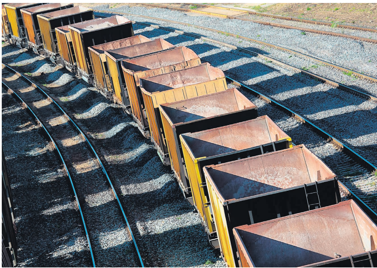
Потери инфраструктурных отраслей от пандемии уже исчисляются триллионами и, если ситуация не повернет в лучшую сторону, могут вырасти более чем вдвое.

Инфраструктурные отрасли РФ уже потеряли в результате распространения COVID-19 1,26 трлн руб., а по итогам пандемии эта цифра превысит 2 трлн руб., оценили в InfraOne Research. Размер убытков зависит от того, введут ли второй этап ограничений, полагают аналитики. В наиболее тяжелом варианте, если повторные ограничения окажутся по масштабу аналогичными весенним, потери инфраструктурных отраслей достигнут 3,2 трлн руб. Однако вероятность такого исхода эксперты оценивают относительно невысоко, на уровне 15%. Оптимистический сценарий с шансами 55%, предполагает восстановление доэпидемических показателей к второму—третьему кварталу 2021 года.