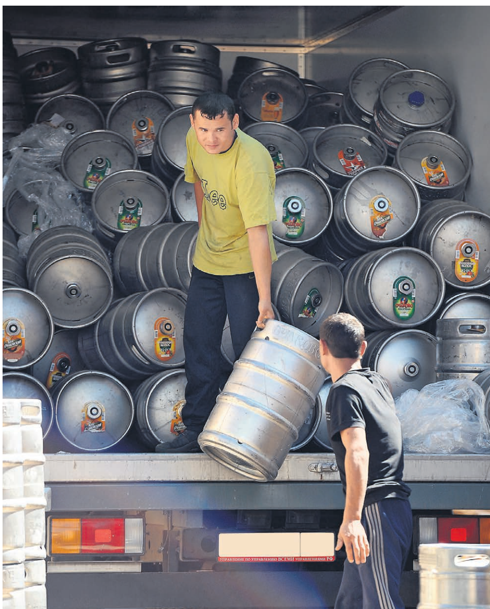
Несмотря на введенный Украиной запрет на поставку российских продуктов, экспорт пива в эту страну растет в промышленных масштабах

Имеющиеся у „Ъ“ данные показывают, что основной объем экспорта на Украину приходится на продукцию трех пивоваренных компаний — МПКБ «Очаково» (марка «Очаково»), ООО «Липецкпиво» («Приятель») и МПК («Жигули», «Хамовники»). Поставки пива МПКБ «Очаково» вы-