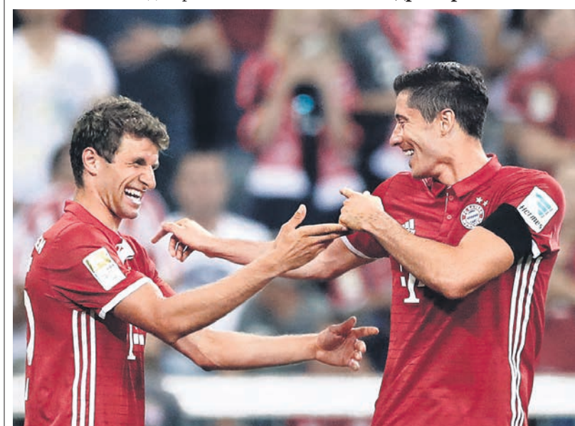
«Ростову» будет очень непросто сыграть против «Баварии», в составе которой есть такие мощные форварды, как Томас Мюллер (слева) и Роберт Левандовский.