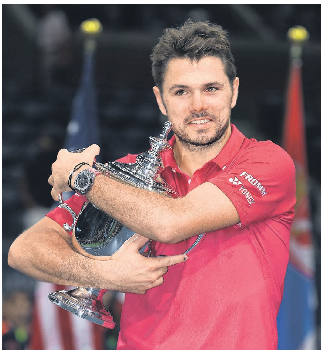
Победа на US Open стала для Станисласа Вавринки третьим за последние три года триумфом на трех разных турнирах Большого шлема

Зато ни в одной из трех оставшихся партий первой ракетки мира так и не удалось выйти вперед. Швейцарец был небезгрешен, однако, еще дважды потеряв свою подачу, он смог взять чужую пять раз. Одноручные удары слева по линии, которыми Вавринка прошивал крепкую оборону Джоковича, приводили в восхищение публику на арене Арту-