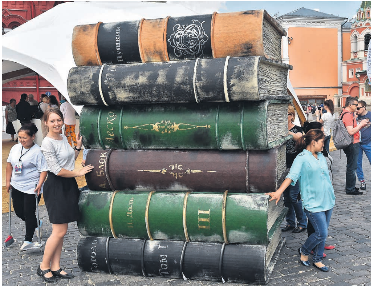
Правительство готово перевести многочисленные энциклопедические тома в электронный формат.

Премьер-министр Дмитрий Медведев распорядился создать рабочую группу, которая займется подготовкой отечественного энциклопедического портала. Группу возглавил вице-премьер Сергей Приходько, в нее также вошли представители Минсвязи, Минобрнауки, Минкультуры, РАН и других структур. Этим распоряжением заканчивается многолетняя история печатной версии Большой российской энциклопедии (БРЭ). Указ о ее издании президент Владимир Путин подписал в 2002 году, первый том вышел через два года. Первоначально ее выпуском занималась ФГУМП «Большая Российская энциклопедия», в 2006 оно было преобразовано в одноименное ОАО со 100-процентным госучастием.