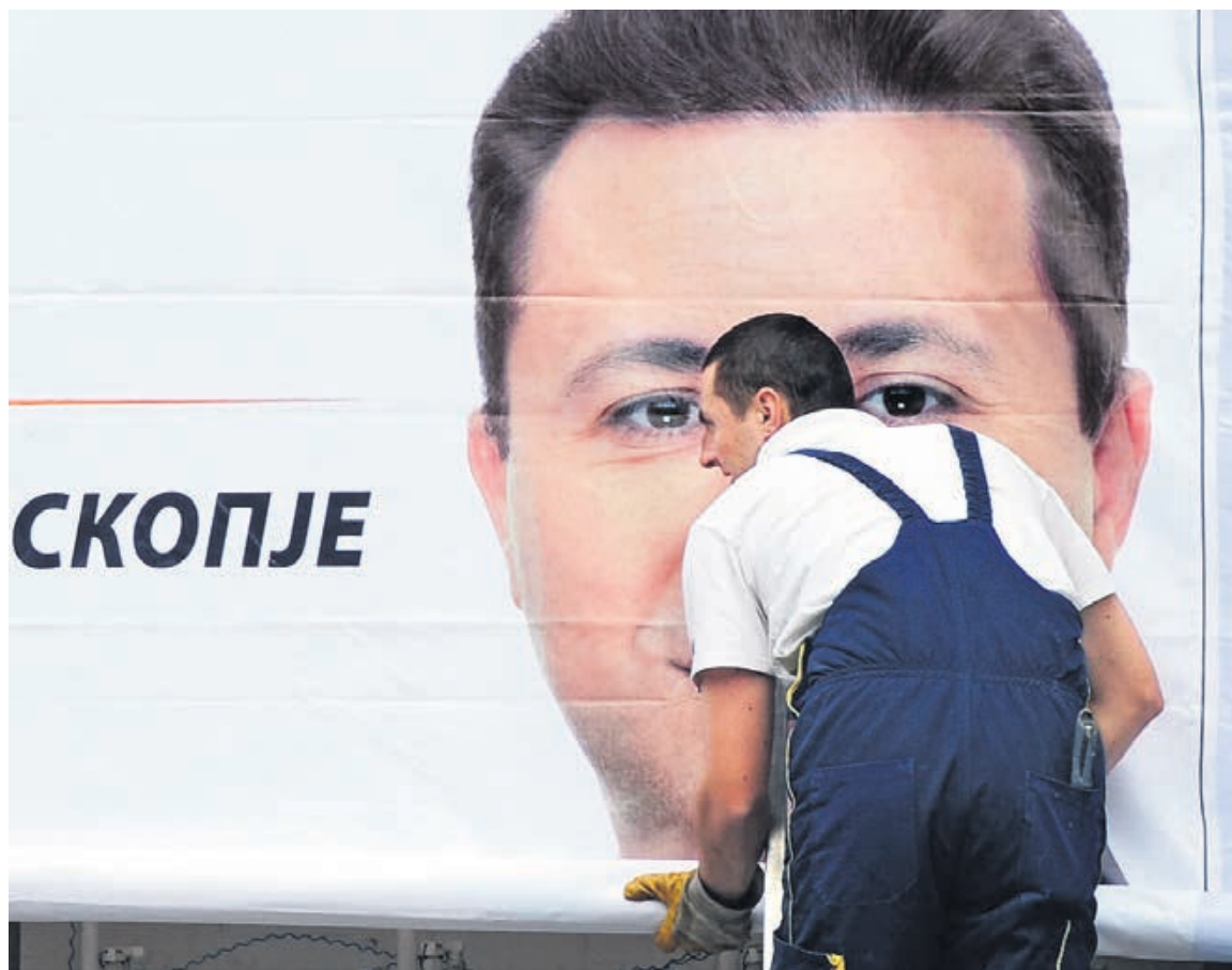
Проблемы премьера Македонии Николы Груевского неожиданно привели страну в большую энергополитику

Заявления премьера Македонии также, по крайней мере отчасти, имеют политическую подоплеку. В последние недели обстановка в Македонии обострилась, оппозиция во главе с Зораном Заевым пытается добиться немедленной отставки правительства. Причем, по мнению главы российского МИДа Сергея Лаврова, ситуация в Македонии «раскручивается извне», а «стоит за всем этим желание воздействовать» на