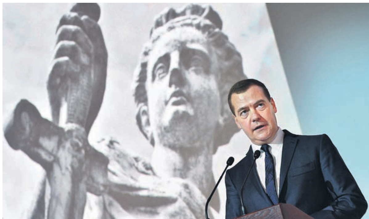
Дмитрий Медведев пообещал равноценный ответ на санкции

Перейдя к взаимным санкциям, Дмитрий Медведев заявил, что не считает это «хорошим развитием международных торговых отношений». Он сообщил, что правительство предостигло решение относительно продления ответных санкций: они, по словам премьер-