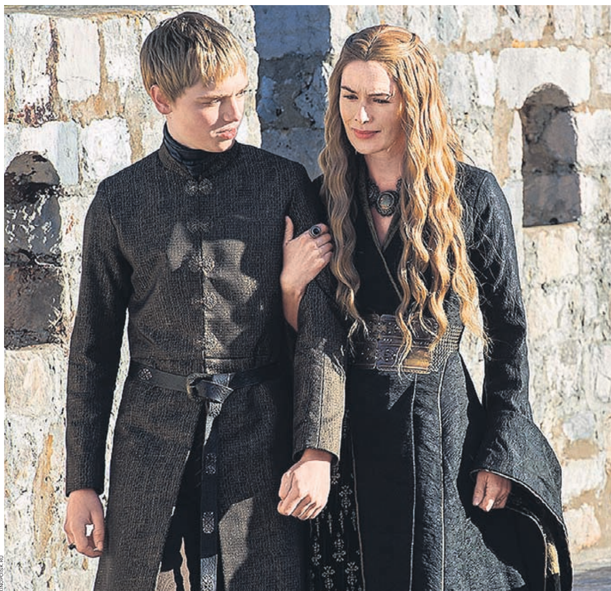
Судя по тому, что мы знаем о новом сезоне «Игры престолов», над Вестеросом вряд ли развиднеется в ближайшее время

«Игра престолов» двигает вперед целый жанр, и нам повезло наблюдать эту историю в развитии. Мартин судорожно дописывает шестую книгу цикла, не забывая между делом держать в тонусе фанатов сериала: установленные им правила игры предполагают, что любой персонаж его шоу не просто смертен, а внезапно смертен — «валар моргулис», как и было сказано. Погибнуть может любой ключевой персонаж исто-