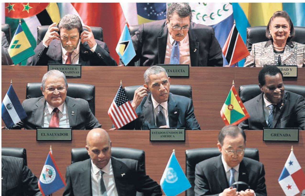
Саммит в Панаме показал, что Латинская Америка перестает быть базой антиамериканизма

В Панаме завершился VII саммит Америк, в котором приняли участие лидеры более 30 глав государств и правительств двух континентов. И хотя по его итогам не было принято официальных документов, форум уже назвали поворотным моментом в истории Западного полушария. Президент США Барак Обама сделавший шаги к нормализации отношений сразу с тремя самыми проблемными для Вашингтона странами — Кубой, Венесуэлой и Бразилией. Налаживание диалога между США и их непримиримыми критиками может означать, что власти этих государств делают ставку не на конфронтацию, а на снятие барьеров в отношениях с Вашингтоном. Впрочем, до полного отказа от неприятия США Латинской Америке еще далеко.