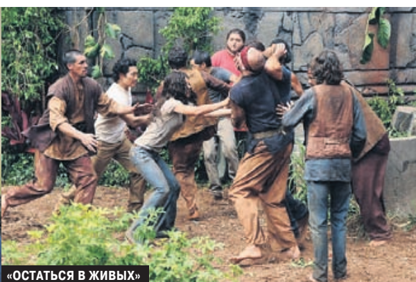
«ОСТАТЬСЯ В ЖИВЫХ»

«Игра престолов» считается одним из самых дорогих в производстве сериалов, но на деле из ныне идущих его уже обскакал «Марко Поло» компании Netflix с $90 млн за сезон. В общем рейтинге самых дорогих сериалов в соотношении бюджет сериал/длительность «Игра престолов» занимает лишь четвертое место, да и пилотный выпуск сериала, несмотря на стоимость в пределах $10 млн, располагается где-то за пределами первой пятёрки.