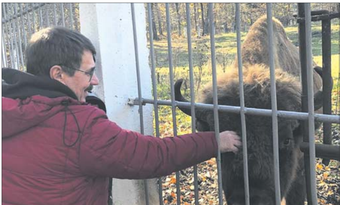
Животных в Тебердинском заповеднике можно погладить.