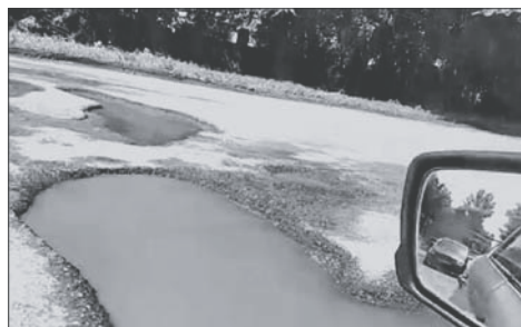
Теперь размывтая дорога станет головной болью дорожных служб.

Из-за постоянных порывов водопровода разрушается дорога на улице Мичурина. Дорожное полотно в сторону поселка ХБК стало похоже на Луну, из-за образовавшихся «кратеров». По словам местных жителей, примерно год назад ямы заделали. Но на данном участке постоянно течет водопроводная вода из-за порывов. В результате относительно недавно засыпанные ямы вновь вымыло.