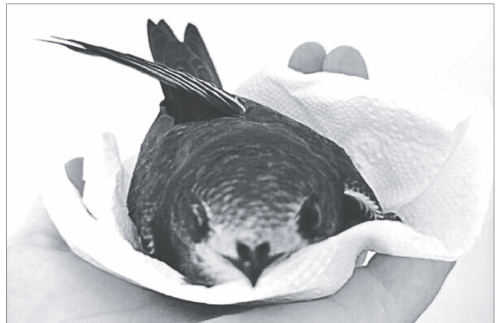
Чтобы покормить стрижа, пришлось из него сделать «шаурму».

Помимо того, что стригам не следует давать слишком много воды (им хватает буквально несколько капель), нужно раз-