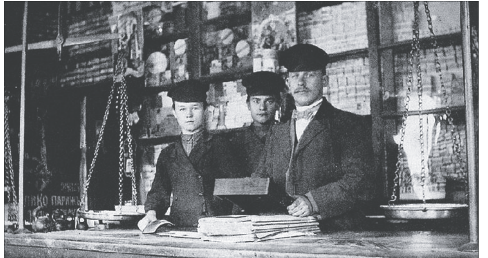
Приказчики в продуктовой лавке.

Причём сами приказчики не были состоятельными людьми, их средняя месячная зарплата составляла около 30 рублей. С началом войны их материальное положение еще сильнее ухудшилось. В связи