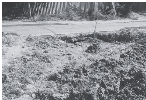
После работ водоканала проезд на улицу оказался заблокирован.

В поселке Власовка водоканал не восстановил дорогу после своих работ.