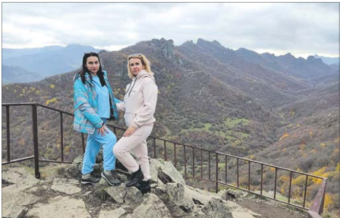
Смотровые площадки Домбая возвышаются над облаками.

В проекте «Открой свою Россию» рассказываем истории простых людей, которые открыли для себя новые горизонты, не потратив при этом много денег. Доступный отдых в пределах нашей страны вполне реален. Сегодняшняя история — от жительницы слободы Краснокуковской Галины Блюхес.