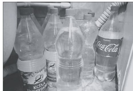
У горожан выработалась привычка иметь дома запас воды.

В редакцию обратились жители улицы Земледельческая в посёлке Поповка. В субботу, 15 июля на улице без предупреждения отключили водоснабжение. До этого две недели вода в домах этого района шла «по ниточке».