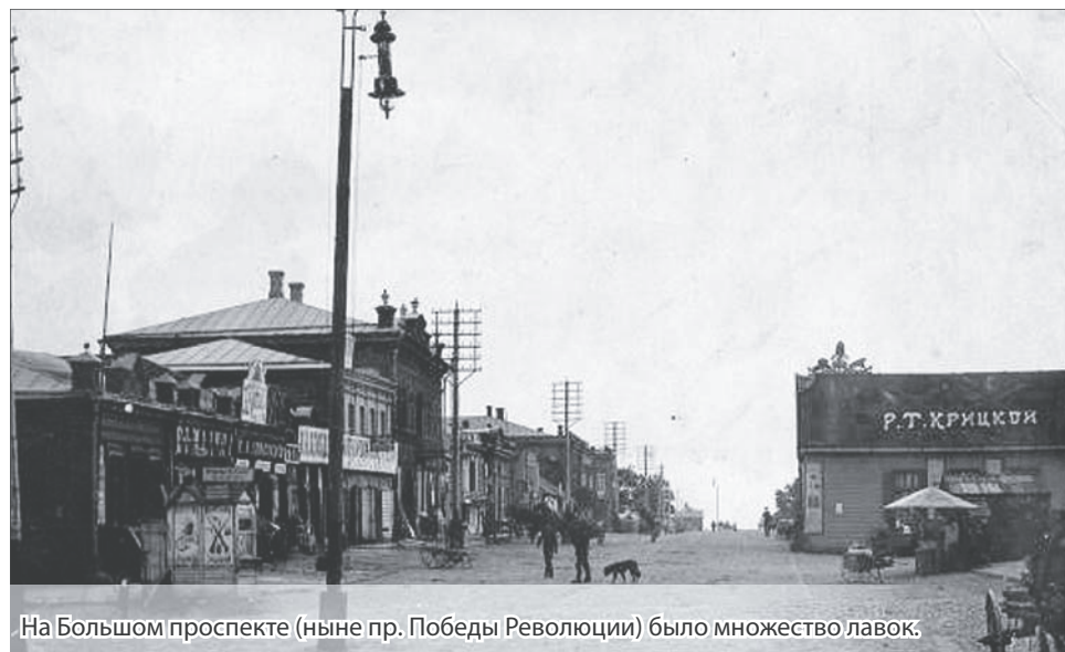
На Большом проспекте (ныне пр. Победы Революции) было множество лавок.