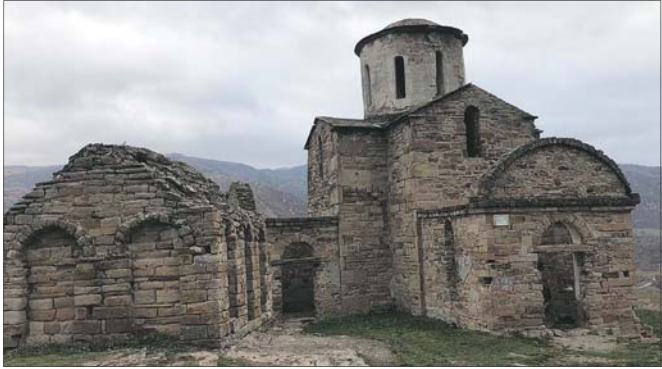
Домбай - это древняя архитектура и храмы.