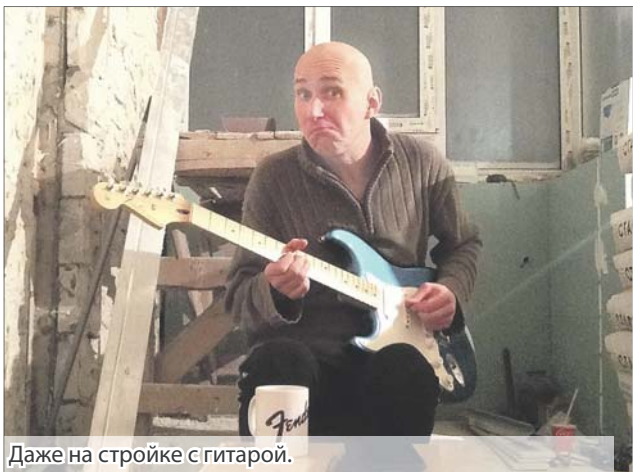
Даже на стройке с гитарой.

По приезду в Питер оказалось все не так просто и романтично.