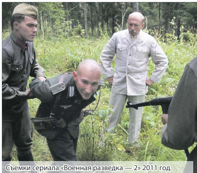
Съемки сериала «Военная разведка — 2» 2011 год.