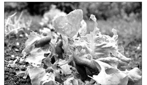
Слизни способны значительно испортить урожай.

Если жабы и лягушки частые гости на вашем участке, то проблем с улитками и слизнями, скорее всего, не будет. Также с вредителями эффективно борются ежи.