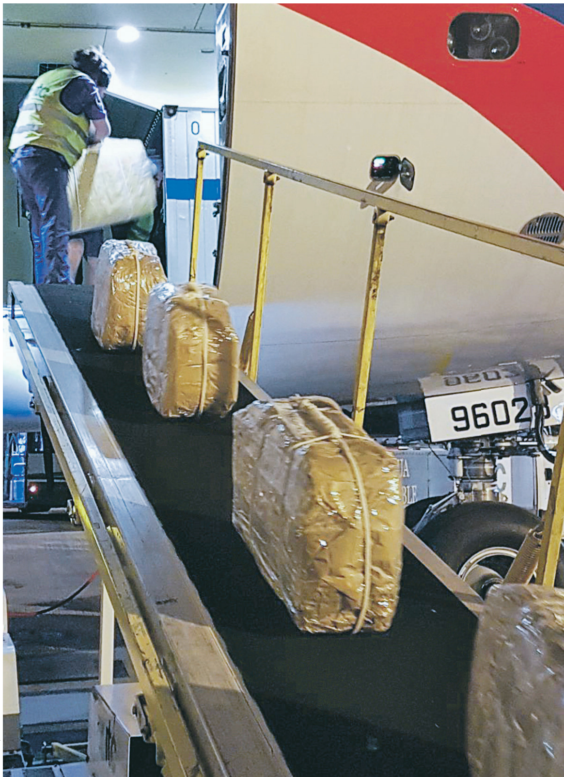
После осмотра российскими экспертами чемоданы по судебному решению изъяли сотрудники Национальной жандармерии Аргентины. Чемоданы оснастили GPS-датчиками, а содержимое заменили на муку