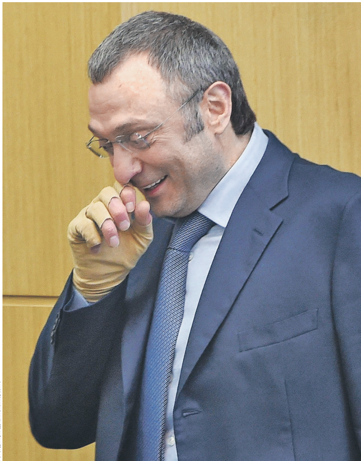
Основной клиент фонда Bonum Capital, объявившего о намерении войти в капитал банка «Возрождение», — семья миллиардера Сулеймана Керимова, утверждают игроки финансового рынка