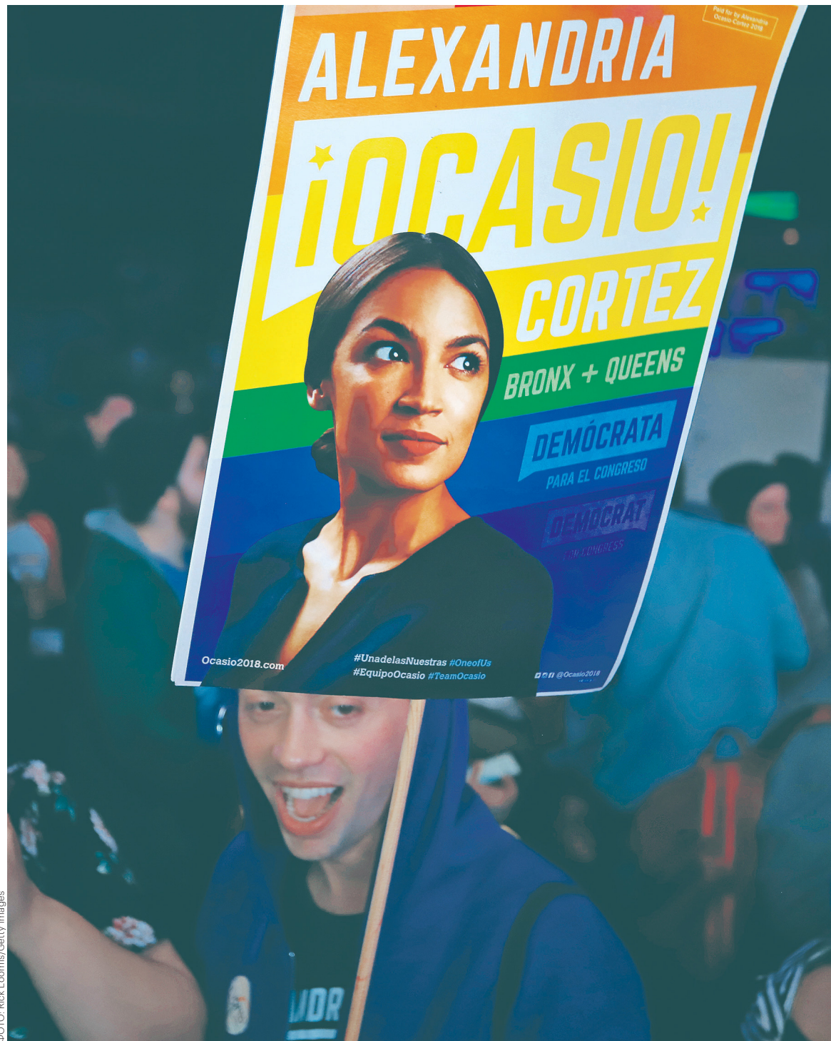
Представительницу демократов Александрию Окасио-Кортес, ставшую самой молодой женщиной в истории палаты представителей, называют новой звездой американской политики

Молодое поколение Демпартии, в том числе Окасио-Кортес, — приверженцы левых взглядов. Движущая сила демократических социалистов — независимый сенатор от Вермонта, 77-летний Берни Сандерс. В 2016 году на праймериз партии он уступил Хиллари Клинтон. Но, как отмечает The Guardian, движение, которое создал Сандерс, захватило многих молодых американцев. За два года число участников организации «Демокра-