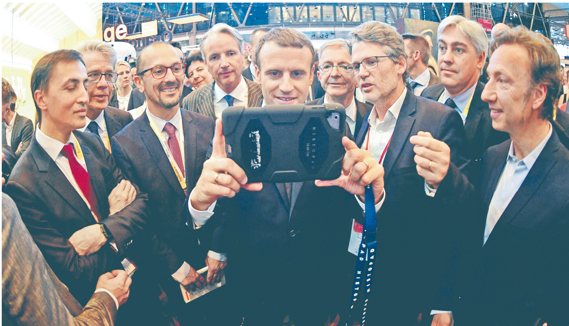
По словам Эмманюэля Макрона (в центре), существует два подхода к регулированию интернета: калифорнийский, предполагающий полную бесконтрольность, и китайский, когда государство полностью контролирует сеть. Президент Франции не является сторонником ни того, ни другого и предлагает альтернативный подход

Четыре вопроса о глобальном проекте по регулированию интернета