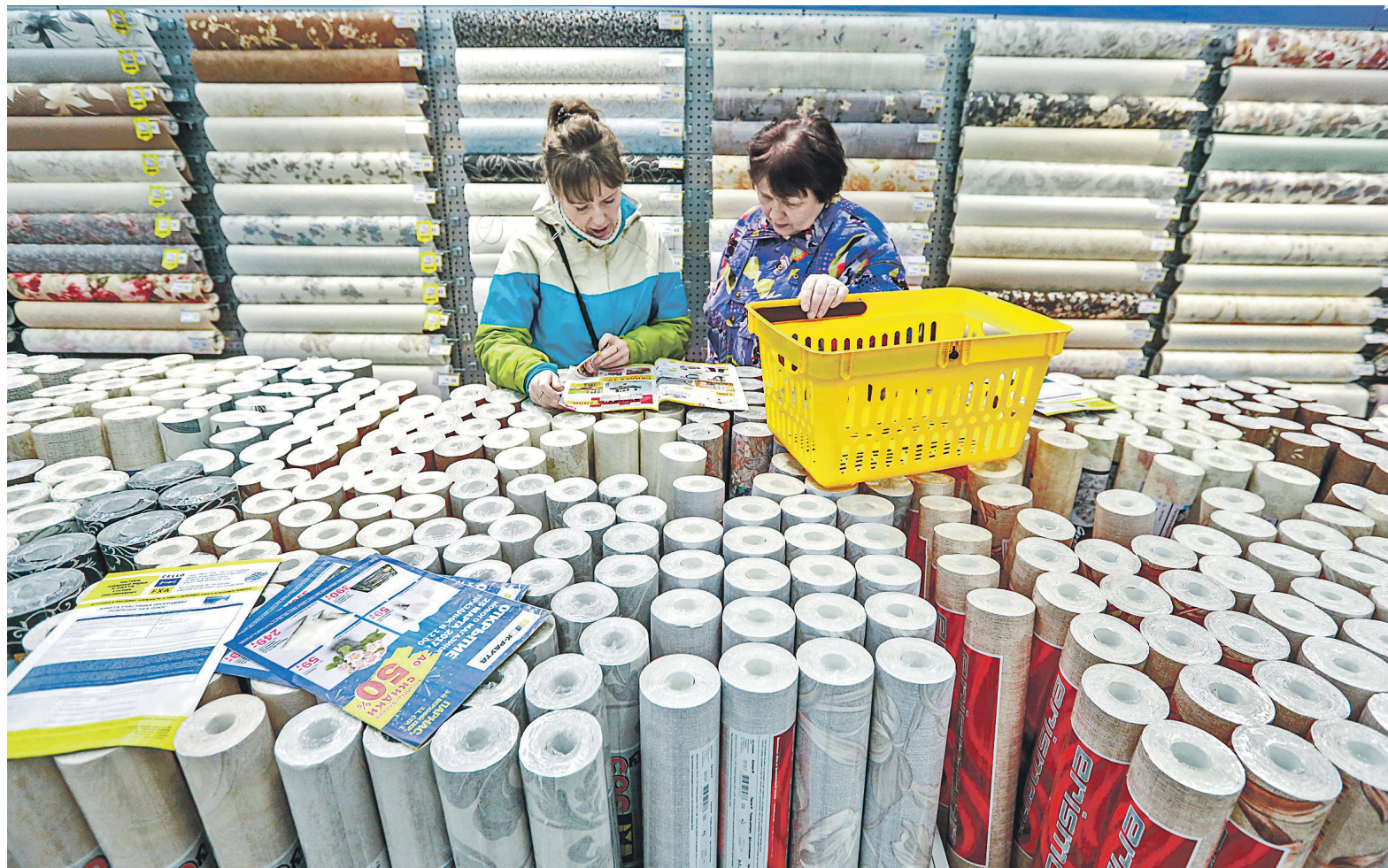
В качестве причины восстановления рынка потребкредитования многие банкиры называют действия ЦБ по снижению ключевой ставки. Это, в свою очередь, позволило банкам снизить ставки по кредитам

Подобную активность в привлечении розничных заемщиков Сбербанком простимулировало