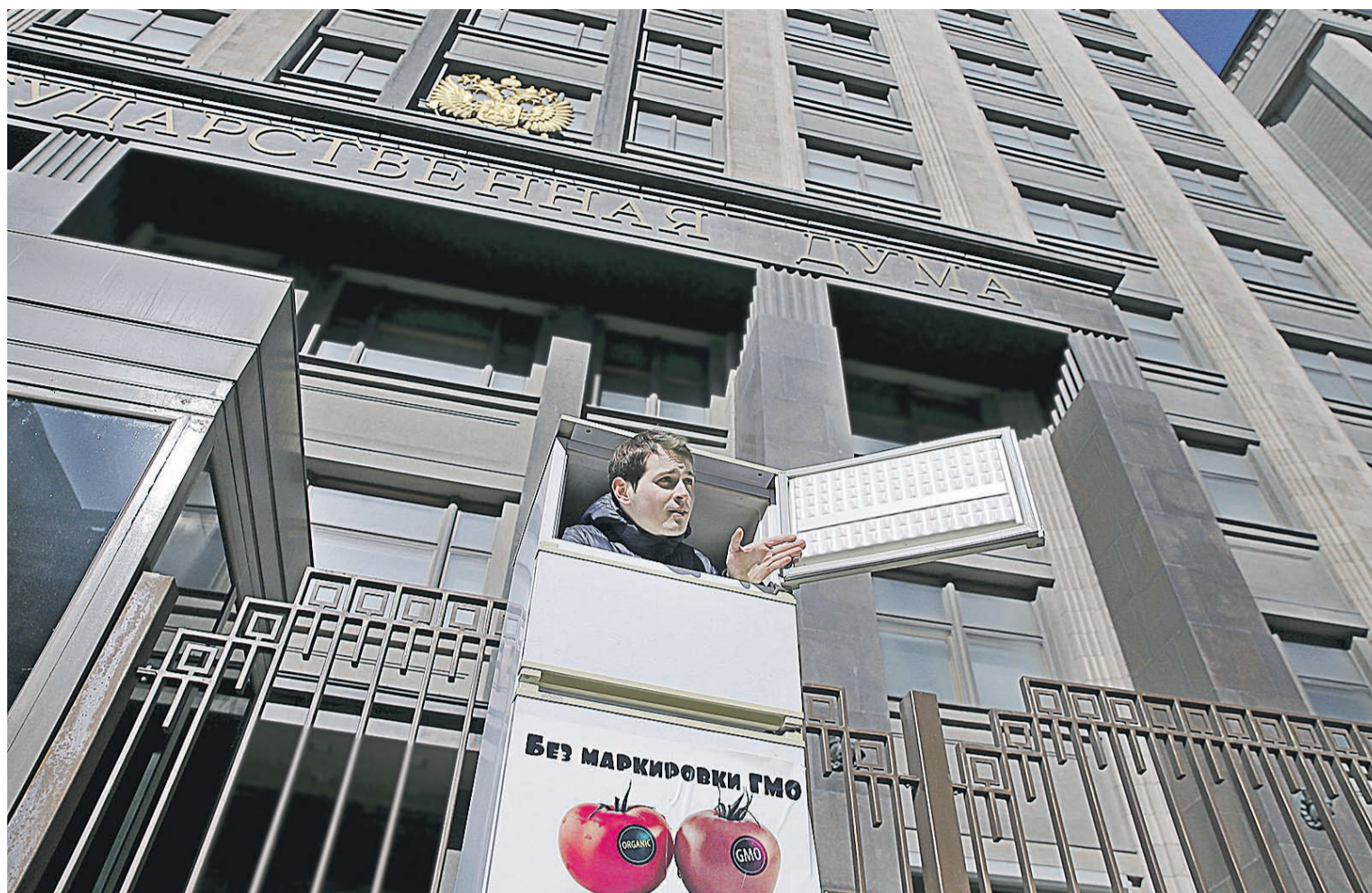
За неоднократные нарушения на митингах теперь можно получить реальный срок (на фото — неизвестный в одиночном пикете у здания Госдумы)

В России впервые судят нарушителей закона о митингах