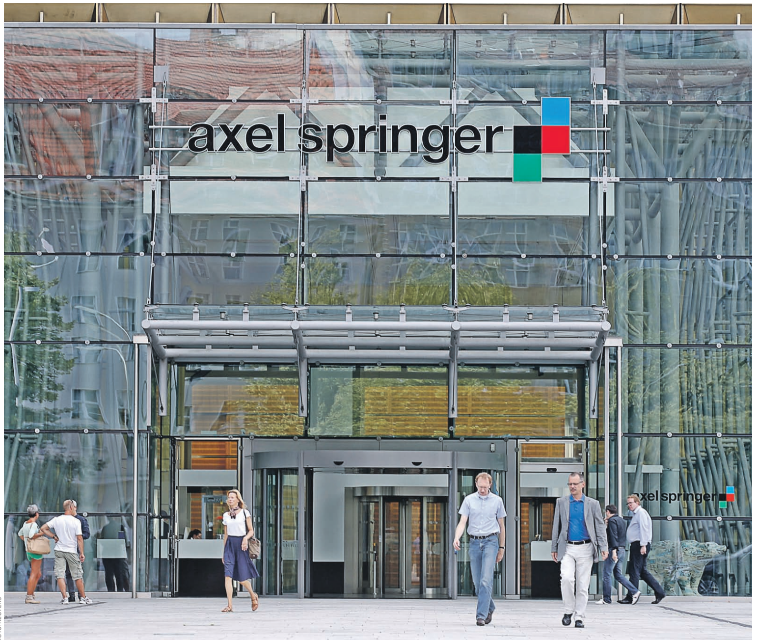
Руководители Axel Springer не захотели быть миноритариями и продали все свои российские активы

Сумма сделки не раскрывается. В 2014 году выручка ЗАО «Аксель Шпрингер Раша» по РСБУ снизилась на