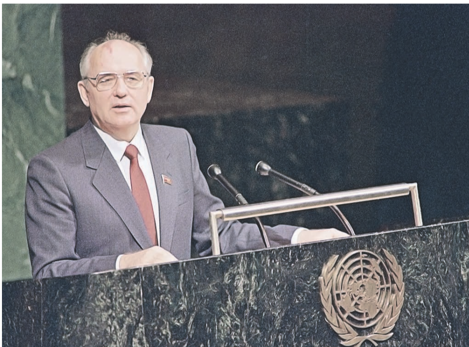
В 1988 году генеральный секретарь ЦК КПСС Михаил Горбачев заявил на Генассамблее ООН, что СССР больше не будет защищать просоветские режимы в других странах. По словам Горбачева, он рассчитывал, что его выступление станет историческим противовесом фултонской речи Уинстона Черчилля, ознаменовавшей в 1946 году начало холодной войны. Горбачев заявил: «Это исторический момент. <...> У нас есть возможность сформировать для нас самих и для будущих поколений новый мировой порядок»