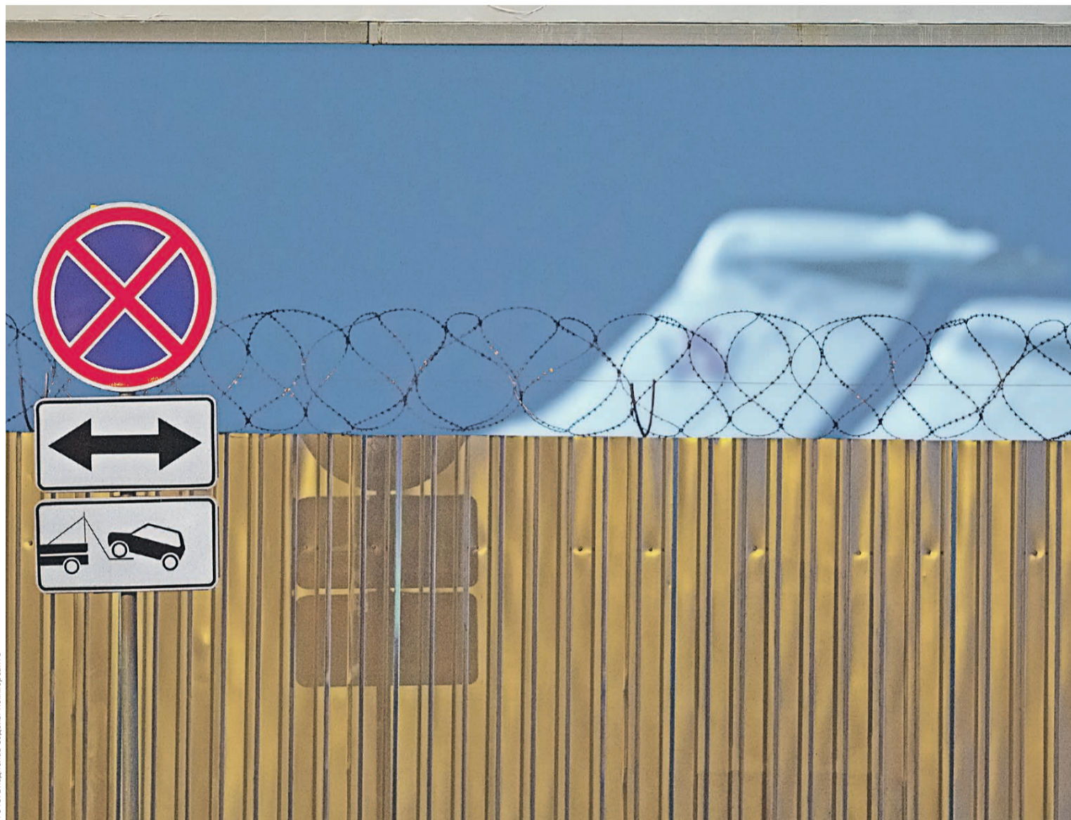
Почти все транзитные полеты над Украиной российские авиакомпании и так прекратили после катастрофы малайзийского Boeing 777 в Донецкой области в июле 2014-го

Сотрудничество в области гражданской авиации между Россией и