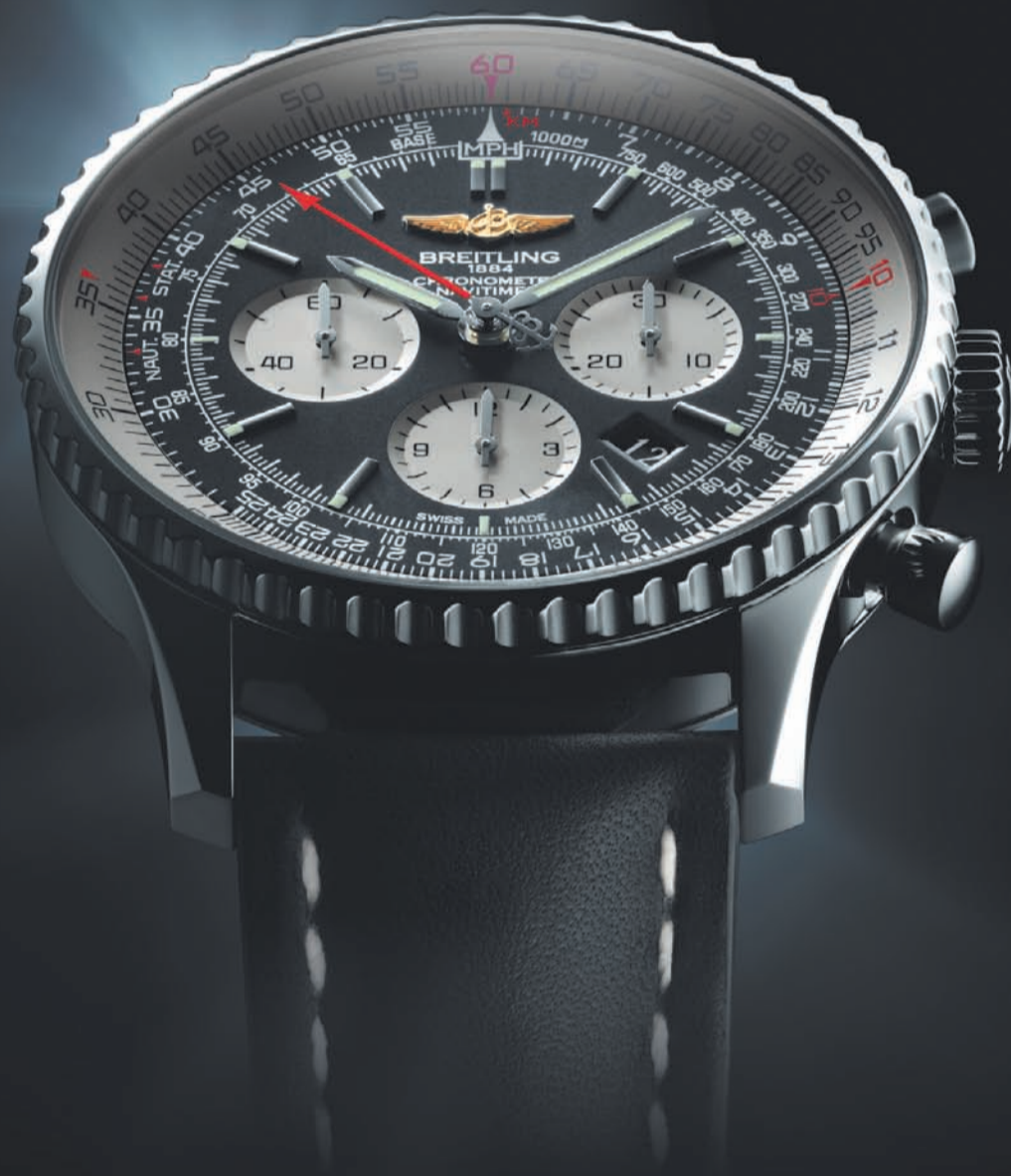
NAVITIMER 46 мм

БУТИК BREITLING ПЕТРОВКА 17 СТР. 1 МОСКВА +7 495 621 96 33