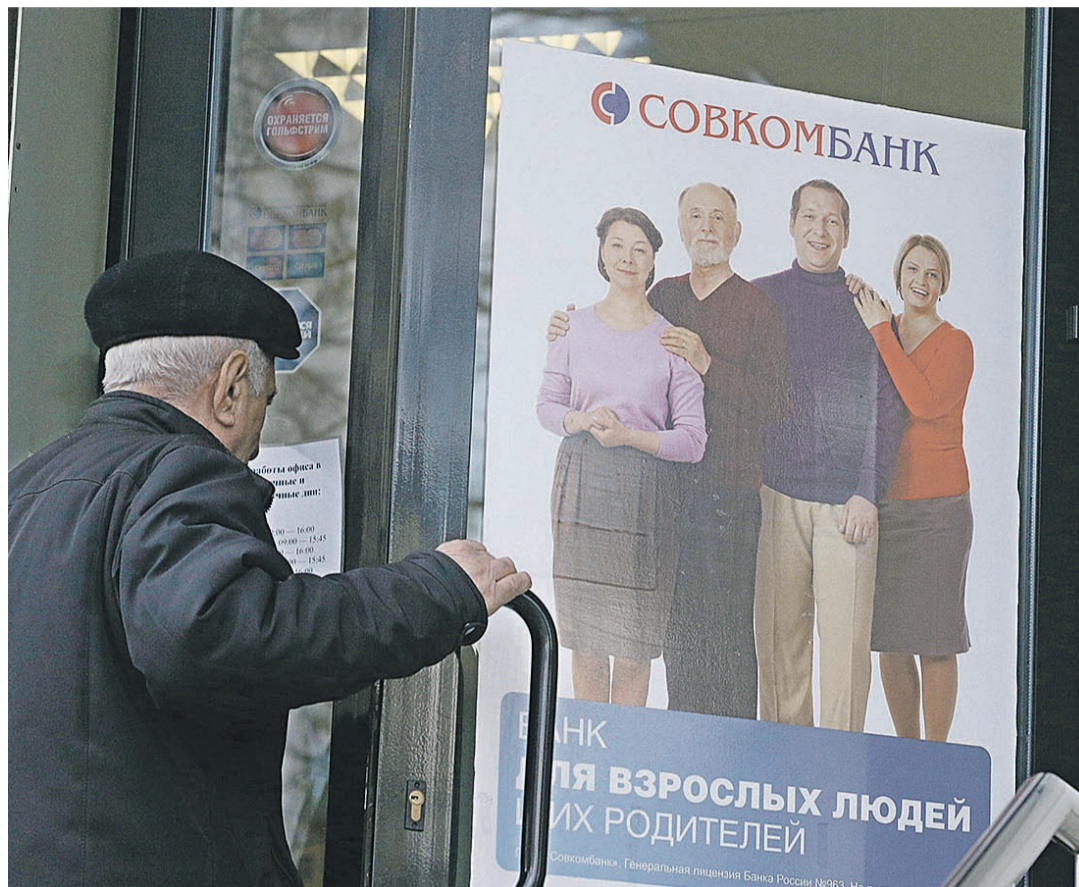
Пенсионеры, на обслуживание которых переориентировался Совкомбанк, помогли ему остаться в прибыли