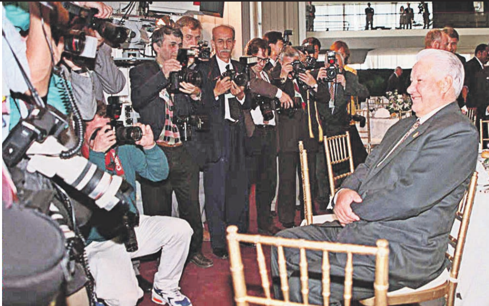
Первый президент России Борис Ельцин выступал на Генассамблеях ООН дважды — в 1994 и 1995 году. В 1995-м, во время юбилейной (50-й) ассамблеи, он также встречался с президентом США Биллом Клинтонем и обсудил с ним конфликт в Боснии. Перед саммитом мировые СМИ писали, что разногласия России и США по поводу Боснии могут превратить Генассамблею в катастрофу. После встречи с Клинтонем в ходе пресс-конференции Ельцин указал пальцем на видеокамеру и сказал: «Катастрофа — это вы!» На фото: Ельцин на одном из мероприятий 50-й Генассамблеи