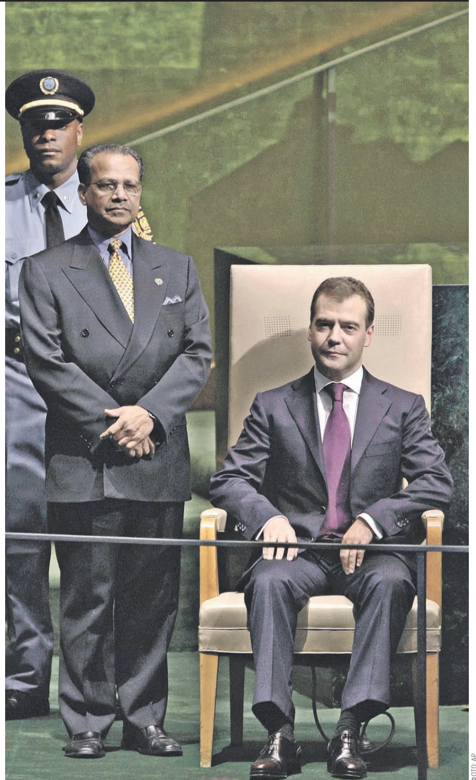
Президент Дмитрий Медведев на Генассамблее ООН 2009 года говорил о необходимости жесткой борьбы с неонацизмом и попытками подвергнуть ревизию итоги Второй мировой войны, глобальной энергетической безопасности и урегулировании региональных конфликтов. «Мы убеждены: с помощью силы можно лишь только обострить ситуацию. Это показала прошлогодняя безрассудная попытка властей Грузии решить проблемы в отношениях с Южной Осетией военными средствами», — сказал Медведев

ухани и Франсуа Олланд, а также Рауль Кастро.