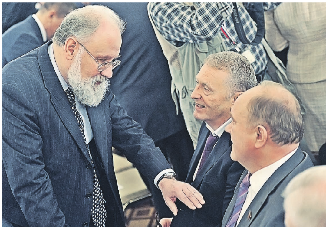
ЛДПР (в центре — лидер партии Владимир Жириновский) и КПРФ (справа — Геннадий Зюганов) попробуют добиться пересчета голосов (слева — глава ЦИК Владимир Чуров) на губернаторских выборах в двух регионах

ЛДПР и коммунисты хотят включить этот вопрос в повестку заседания