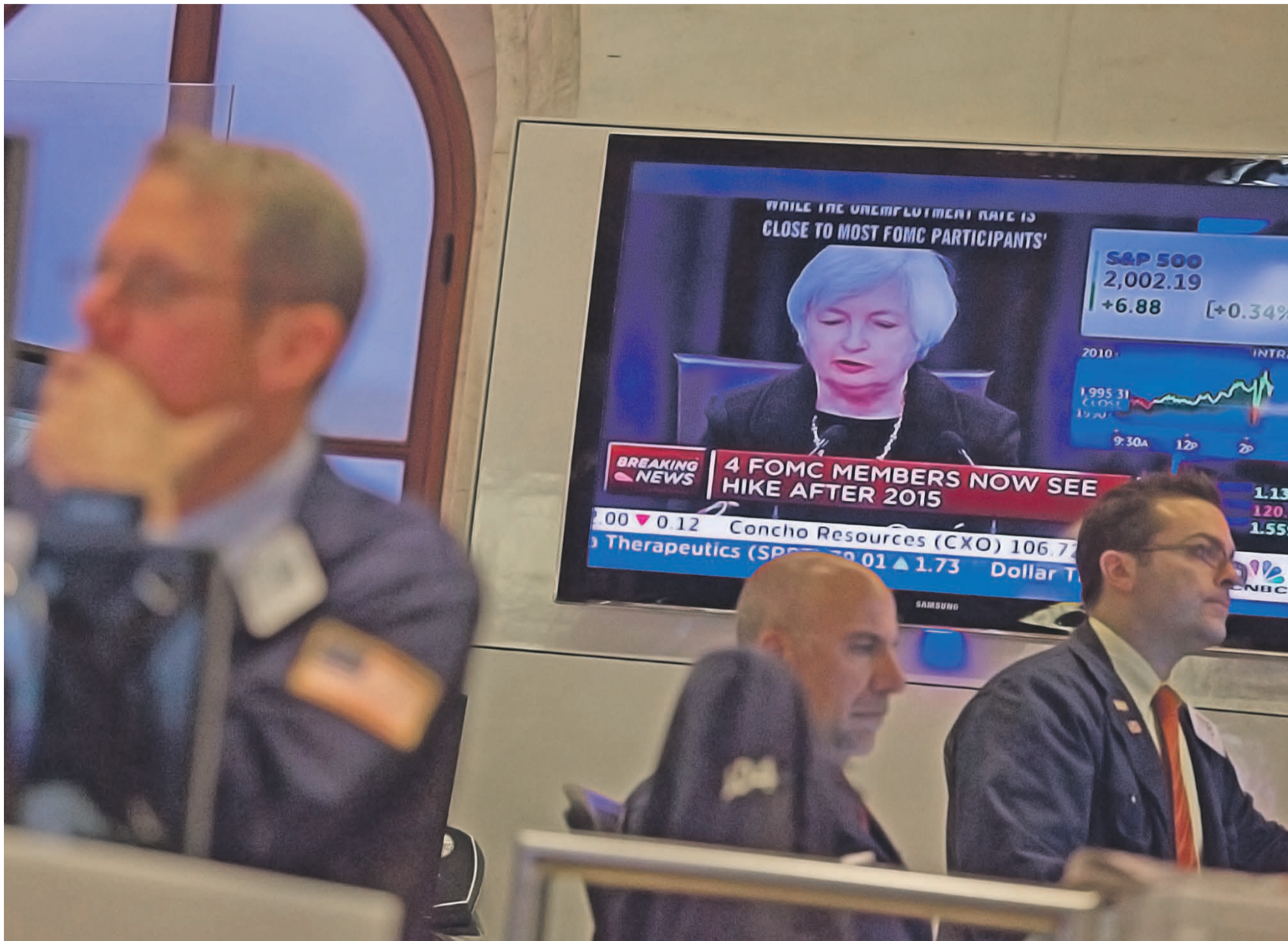
Ведомство Джанет Йеллен (на фото на заднем плане) обещает поднять ключевую ставку не раньше, чем увидит дальнейшие улучшения на рынке труда и убедится, что инфляция стремится к целевому показателю в 2%

ФРС США оставила ключевую ставку на прежнем уровне