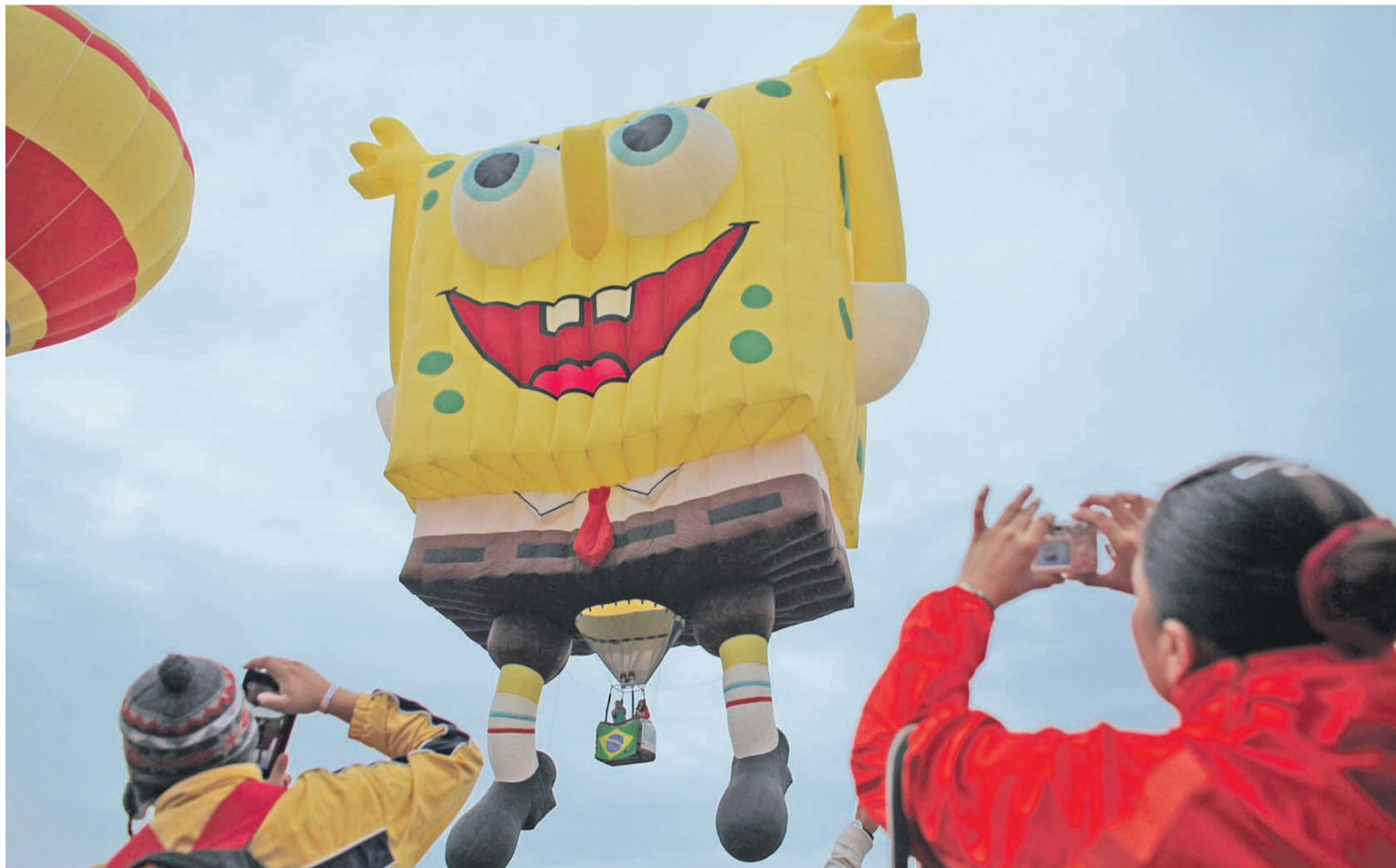
Самый популярный из российских каналов Viacom, совладельцем которой может стать Виктор Вексельберг, — детский Nickelodeon. На фото — мультипликационный персонаж Губка Боб, которого можно назвать лицом канала