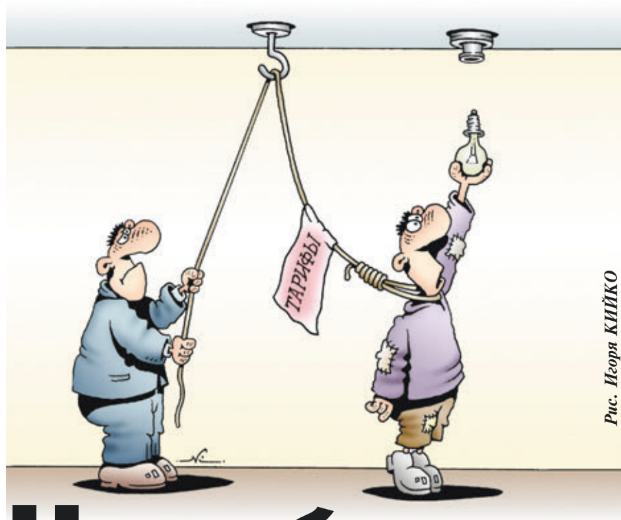
Рис. Игорь КИЙКО