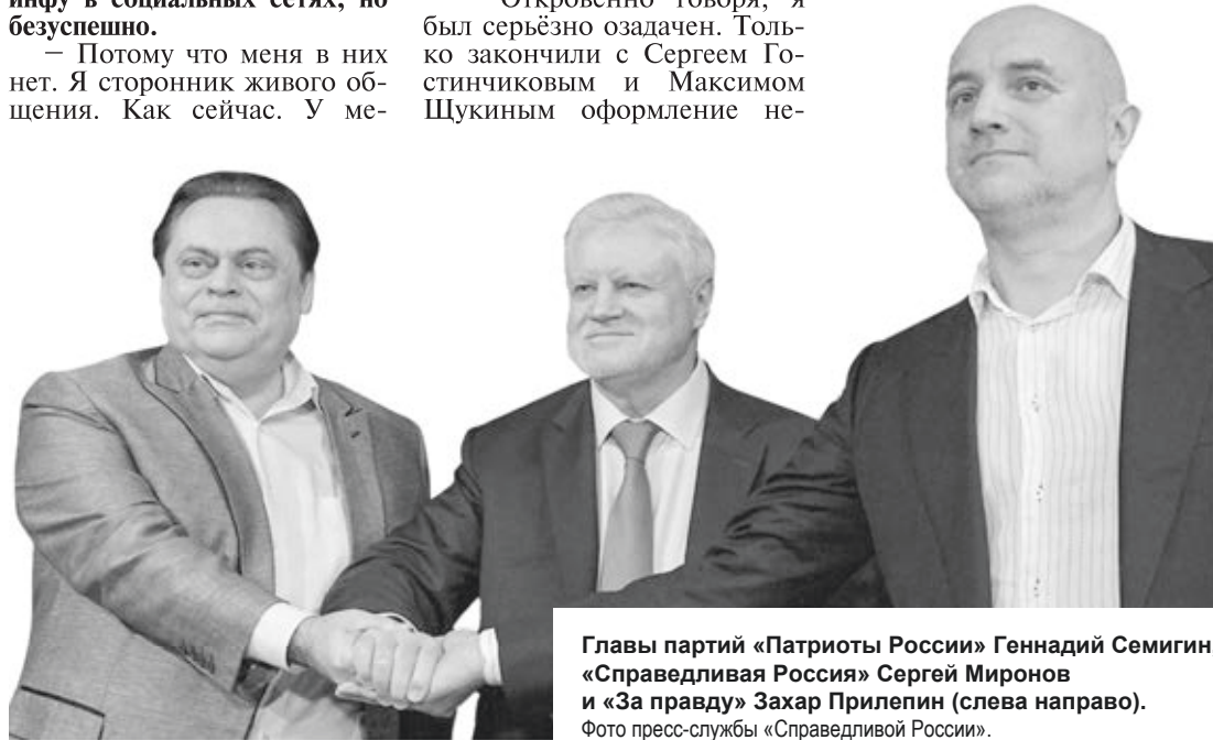
Главы партий «Патриоты России» Геннадий Семигин, «Справедливая Россия» Сергей Миронов и «За правду» Захар Прилепин (слева направо).