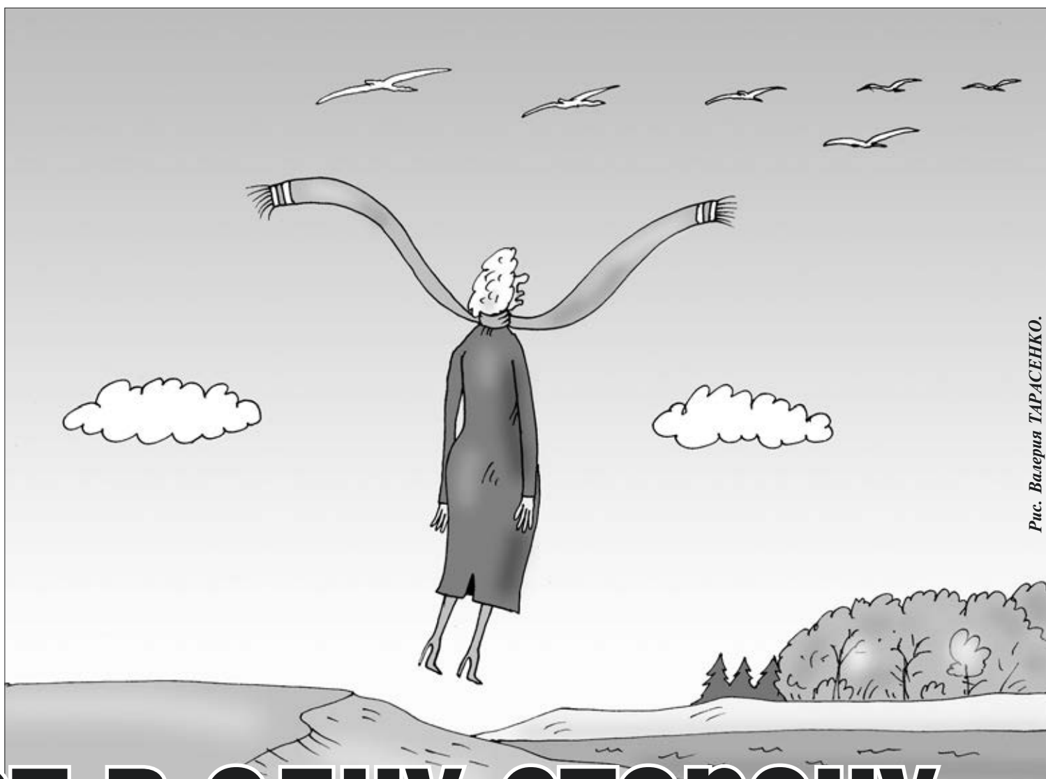
Рис. Валерия ТАРАСЕНКО.

ТЕРРИТОРИЯ , на которой сегодня располагается Еврейская автономная область, была и пока остаётся землёй мигрантов. История её освоения весьма коротка — чуть более полутора веков. Почти половина этого срока — с середины 60-х годов XIX века до 30-х XX она заселялась точечно: это были отдельные казачьи станицы по берегам Амура, которые предназначались в основном для того, чтобы за столбить за Россией эти пустующие просторы. Хозяйственная деятельность сводилась к обеспечению жизненных потребностей местных